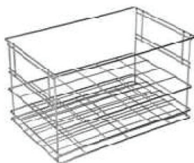
Panier avec poignées incorporées