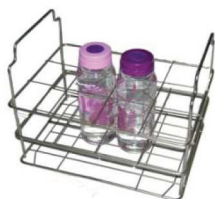
Panier avec poignées hautes

Ils sont disponibles avec anse de transport centrale (modèles non superposables) ou avec 2 poignées de transport latérales hautes ou incorporées dans le panier (modèles superposables).